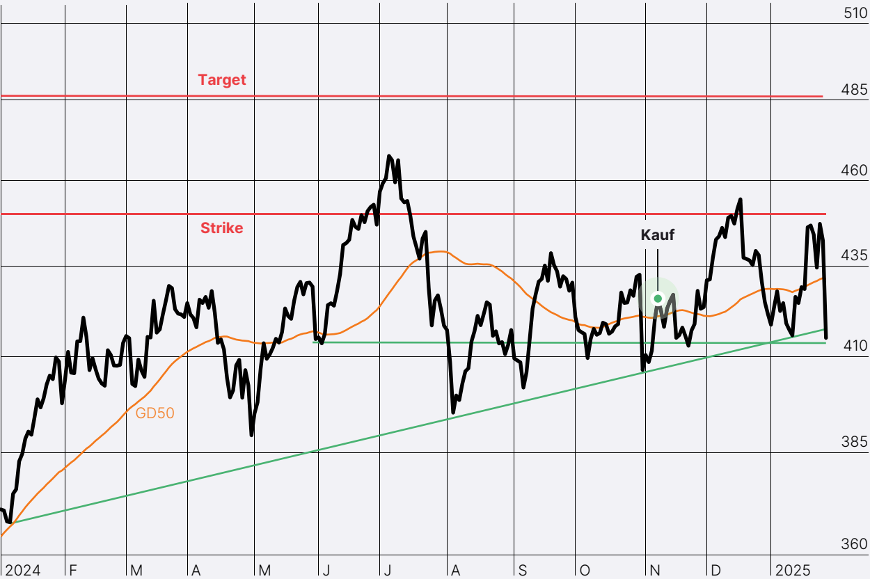
Microsoft in US-Dollar

Microsoft bleibt auf Erfolgskurs. Im zweiten Quartal des Geschäftsjahres 2025 erzielte der Tech-Riese einen Umsatz von 69,6 Milliarden Dollar, ein Plus von zwölf Prozent gegenüber dem Vorjahr. Der operative Gewinn stieg um 17 Prozent auf 31,7 Milliarden Dollar. Besonders beeindruckend: Die KI-Sparte verzeichnete einen Umsatzsprung von 175 Prozent und überschritt erstmals die Marke von 13 Milliarden Dollar pro Jahr. Trotz dieser beeindruckenden Zahlen gab es leichte Sorgenfalten. Anleger hinterfragen die hohen Ausgaben für KI und deren Rentabilität. Zudem steht Microsoft unter verstärkter Beobachtung der deutschen Wettbewerbsbehörden, die eine genauere Prüfung angekündigt haben.